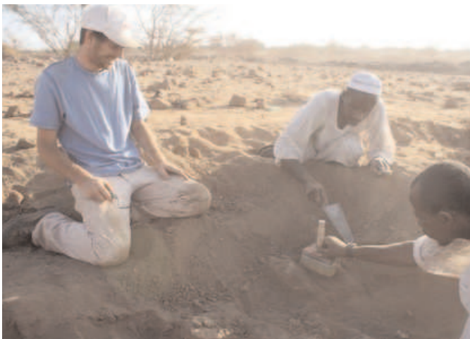
Objev fragmentů sousoší boha Amona a bohyně Mut (Pavel Onderka)

Česká expedice archeologů v Súdánu poslední dobou nalézá velmi zajímavé objevy. Začalo to několika soškami, ale až poté našli starodávňý chrám. Zjistilo se, že nalezené kostry, sošky, prsteny i chrám patřily do vůbec nejjižnějšího města tehdejšího starověkého světa. Město s názvem Arabikeleb leželo nedaleko dnešního hlavního súdánského města Chartúmu.